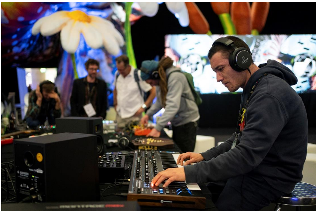
Hands-on Technik und Wissenstransfer: MusicOneX @ Prolight + Sound