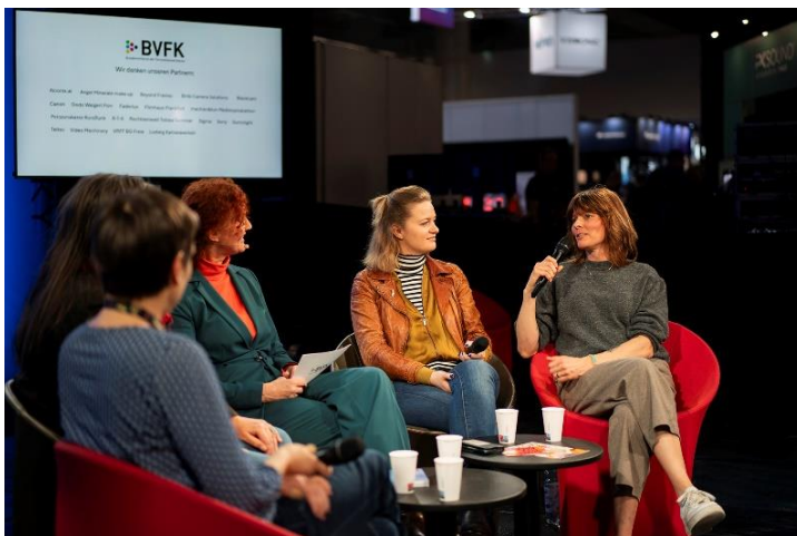
Der Image Creation Hub bietet inspirierende Talks und Panels mit Branchenprofis.