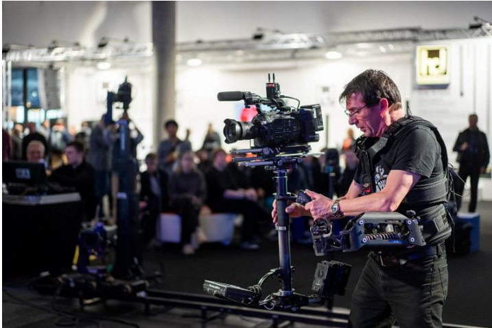
Im Image Creation Hub treffen praktische Anwendungen auf fachliches Know-how.